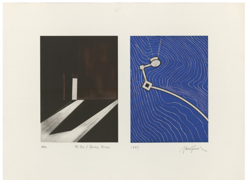
James Turrell, West Chamber, Blatt 3 der Folge «Mapping Spaces», 1987, Heliogravüre, Aquatinta und Radierung, 56.0 x 78.5 cm, Inv.-Nr. 2008.2510

Die Graphische Sammlung ist Teil der ETH-Bibliothek. / The Graphische Sammlung ETH Zürich is part of the ETH Library.